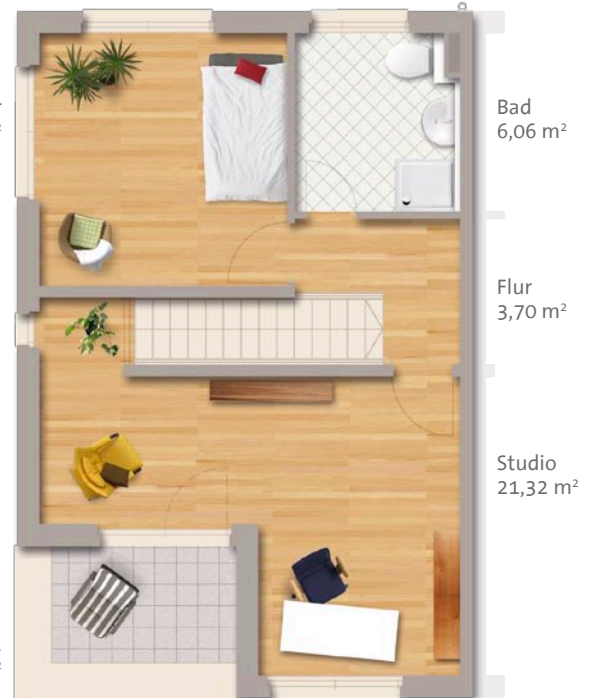
Dachgeschoss – Ausbau Standard

Alle Maße und Flächenangaben sind Circa-Angaben. Zeichnerische Darstellungen von Einrichtungsgegenständen sind nicht Bestandteil der Baubeschreibung. Änderungen vorbehalten – auch im Farbkonzept. Die Darstellung der Gebäudeansichten in diesem Prospekt ist beispielhaft. Die tatsächliche Ausführung kann abweichen.