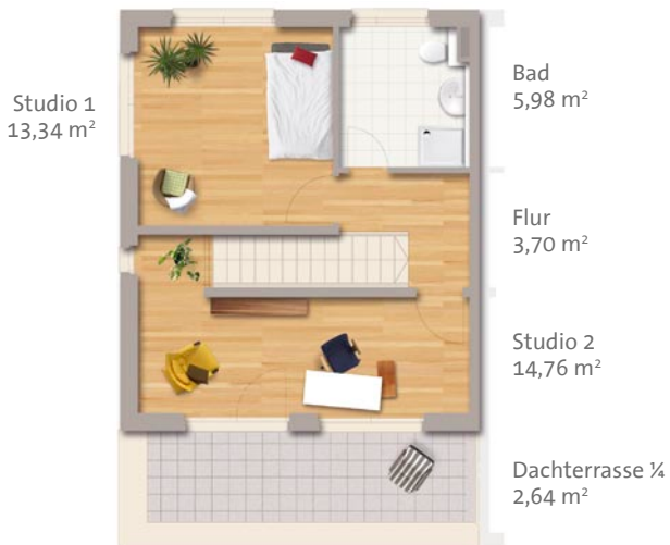
DG Variante – Sonderwunsch